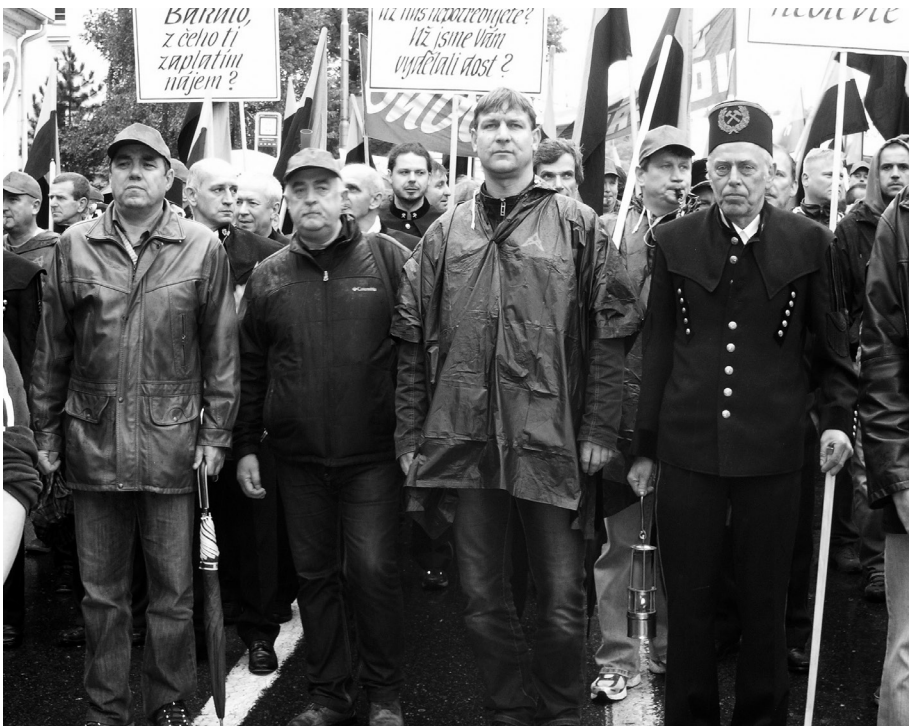
Záběr z hornické demonstrace v Ostravě v roce v září 2013.

Tak bych to nestavěl a havířům bych nic nezalíval. Stát by se měl spíše zamyslet, jestli zbytečně nedotuje takzvaně nezaměstnatelné. Tedy lidi, kteří pracovat nechťejí, i když by mohli.