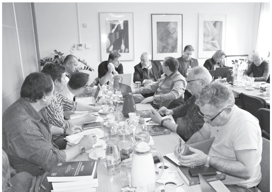
Záběr z jednání rady svazu.

Rada svazu schválila delegáty na jednání dubnového VII. sjezdu ČMKOS a informovala o zvýhodněných cenách pobytu pro členy svazu v hotelu Harmonie v Luhačovicích. Text a foto: pek